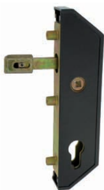
Serrure GJ en retrait