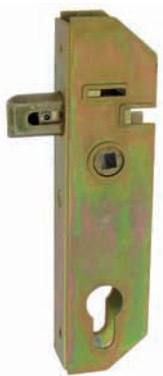
Serrure GJ à encastrer