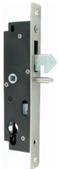
Serrure GK à encastrer