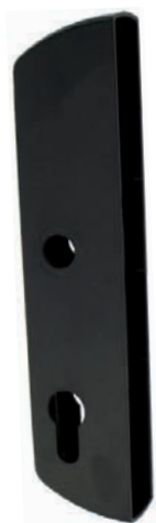
Capot pour GK en retrait