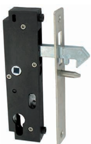
Serrure GK en retrait