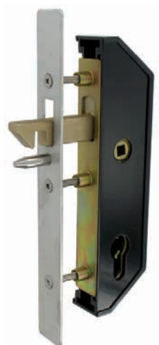
Serrure GJ en retrait