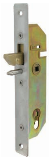
Serrure GJ à encastrer

Vous référer également à notre nouvelle serrure GK page 16.