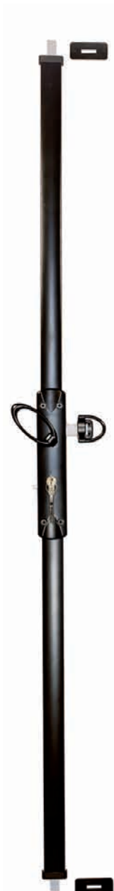
MULTIRÉVERSO avec carénage