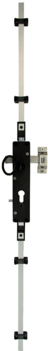
MULTIRÉVERSO sans carénage

Adaptable sur tous types de volet battant, bois, PVC ou aluminium, cette serrure offre, en plus d'une excellente sécurité grâce à une fermeture multipoints, une réversibilité parfaite et une esthétique soignée. Un large éventail d'équipement de cette serrure vous est proposé : pênes droits ou contre-coudés pour répondre à toutes les contraintes d'installation, possibilité de carénage partiel ou complet, organe de manoeuvre à la carte parmi toute notre gamme d'anneaux et béquilles, simples ou doubles.