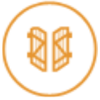
Volets battants bois