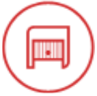
Portes de garages