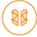
Volets battants PVC et aluminium