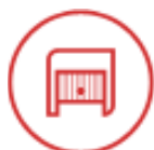
Portes de garages