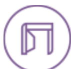
Menuiserie et agencement