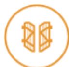
Volets battants PVC et aluminium