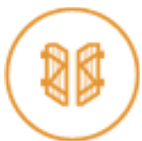
Volets battants PVC et aluminium