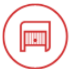
Portes de garages