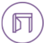
Menuiserie et agencement